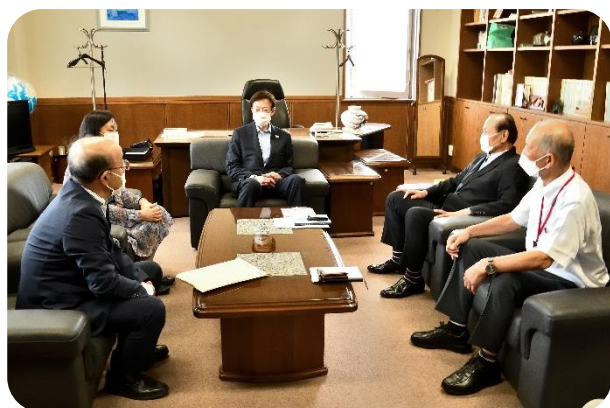
KSC に来校された久元市長