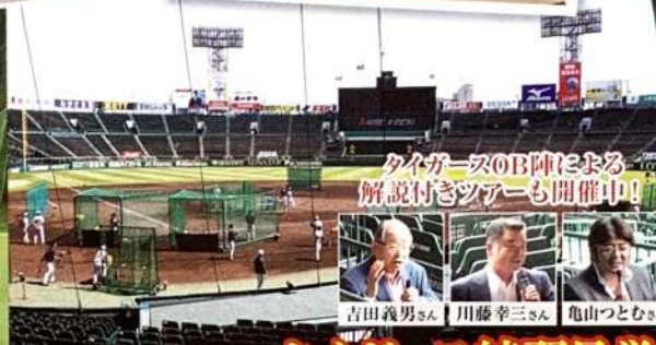
タイガース練習見学 (バックネット裏スタンド) ※試合日のみ

タイガースOB陣による 解説付きツアーも開催中! 吉田義男さん 川藤幸三さん 亀山つとむさん