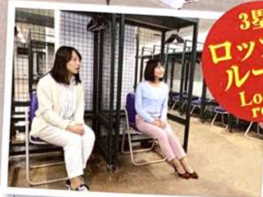
3塁ロッカールーム Locker room