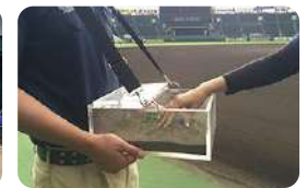
甲子園の土を触る体験